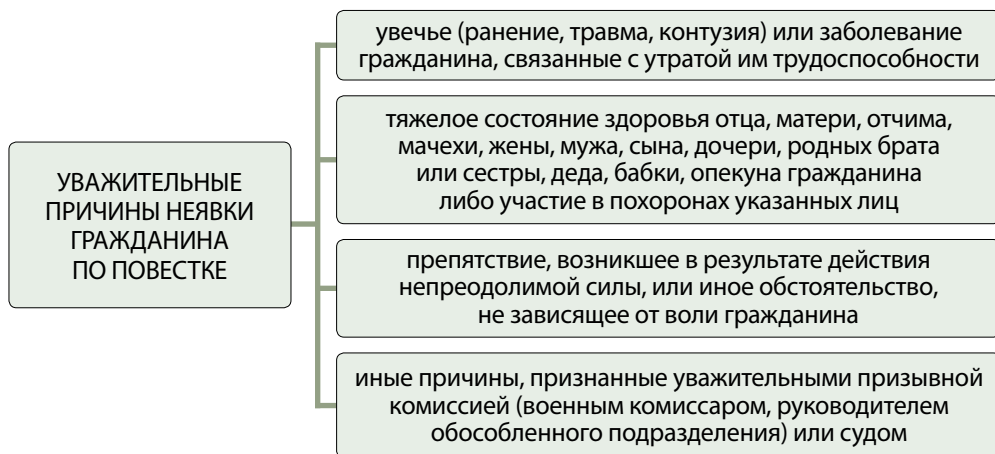
Рис. 39. Уважительные причины неявки гражданина по повестке

Права, обязанности и ответственность призывника. Граждане, не явившиеся без уважительных причин на место и в срок, указанные в повестках или направлениях военного комиссариата (обособленного подразделения) или иного органа, осуществляющего воинский учет, нарушившие обязанности по воинскому учету, уклоняющиеся от мероприятий по призыву на воинскую службу, либо от явки на сборы или занятия и учебные сборы, либо от воинского учета или отказавшиеся от получения повесток или направлений военного комиссариата (обособленного подразделения) или иного органа, осуществляющего воинский учет, привлекаются к ответственности в соответствии с законодательными актами Республики Беларусь (рис. 39).