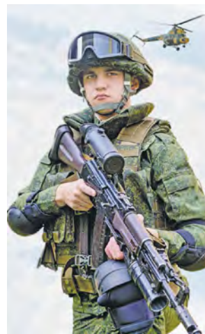
Рис. 37. Военнослужащий Вооруженных Сил Республики Беларусь

Чем является воинская служба для граждан Беларуси?