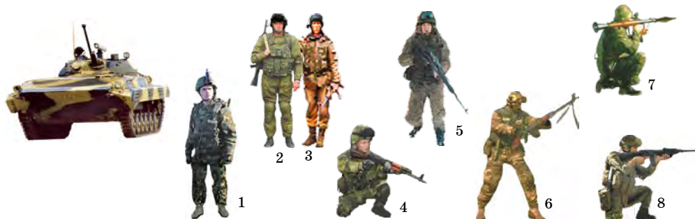
Рис. 99. Состав мотострелкового отделения: 1 — командир боевой машины, командир отделения (АК-74, ГП-25); 2 — наводчик-оператор (АК-74); 3 — старший механик-водитель (механик-водитель) (АКС-74У); 4 — старший стрелок (АК-74, ГП-25); 5 — снайпер (СВД); 6 — пулеметчик (РПК-74); 7 — гранатометчик (РПГ-7В, АКС-74У); 8 — стрелок — помощник гранатометчика (АК-74)

Мотострелковое отделение — первичное тактическое подразделение, входит в состав мотострелкового взвода. При выполнении боевых задач действует в составе взвода, может действовать самостоятельно.