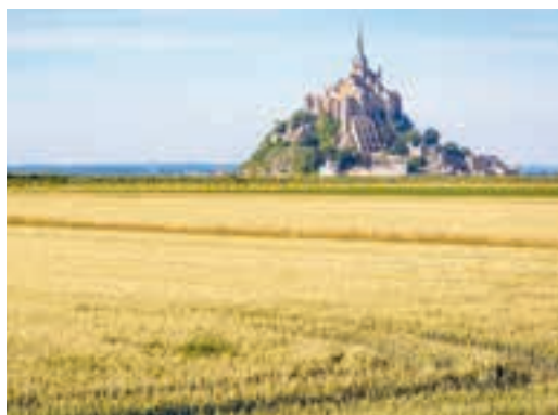
Мал. 129. Пшанічныя палі ў Францыі

генетычна мадыфікаваных сельскагаспадарчых культур, г. зн. з такімі зададзенымі ўласцівасцямі, як устойлівасць да шкоднікаў, ядахімікатаў, павышанае ўтрыманне вітамінаў. З аднаго боку, гэта дазваляе палепшыць рацыён харчавання жыхароў многіх краін, а з другога — выклікае бурныя дыскусіі аб іх шкодзе. Прывядзіце