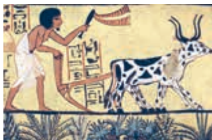
Мал. 125. Зараджэнне сельскай гаспадаркі

Па меры развіцця індустрыялізацыі і постындустрыялізацыі доля сельскай гаспадаркі стала змяншацца. У структуры сусветнага