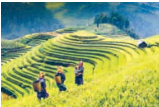
Мал. 130. Тэрасныя рысавыя палі ў В'етнаме