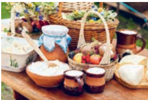
Мал. 131. Прадукцыя арганічнай сельскай гаспадаркі