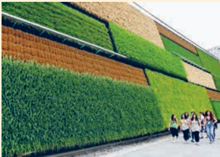
Мал. 127. Інавацыі ў сельскай гаспадарцы Ізраіля — вертыкальная пасадка на сценах дамоў

У свеце цікавага. Ізраільская сельская гаспадарка — гэта сусветны феномен. У краіне, дзе менш за 20 % зямель прыдатныя для вядзення сельскай гаспадаркі, фермеры забяспечваюць патрэбы насельніцтва ў прадуктах харчавання на 95 %. Пры гэтым Ізраіль не толькі забяспечвае ўласныя харчовыя патрэбы, але і паспяхова экспартуе сваю прадукцыю ў дзясяткі краін. Сакрэт поспеху ізраільскага аграсектара — тэхналогіі. Інавацыйныя падыходы Ізраіля да вядзення сельскай гаспадаркі зніжаюць кліматычныя рызыкі і садзейнічаюць рацыянальнаму выкарыстанню найкаштоўнейшых для пустыннага клімату водных рэсурсаў (мал. 127)