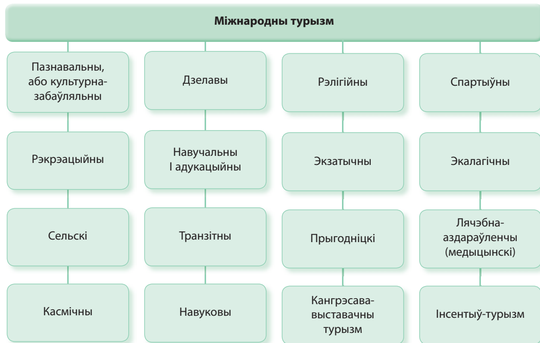
Мал. 194. Віды міжнароднага турызму па мэце падарожжа

Віды міжнароднага турызму. У залежнасці ад ступені выкарыстання турысцка-рэкрэацыйных рэсурсаў і галоўнай мэты падарожжа вылучаюць некалькі відаў турызму (мал. 194). Пры гэтым нараўне з традыцыйнымі ў сучасным свеце з'яўляюцца новыя віды турызму. Напрыклад, экзатычны турызм прадугледжвае наведванне маладаступных геаграфічных аб'ектаў, знаёмства з нацыянальнымі звычаямі і кліматам, кухняй і інш.