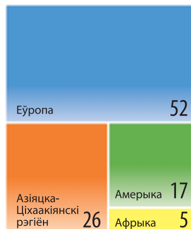
Мал. 196. Структура міжнародных турысцкіх прыбыццяў па рэгіёнах, 2017 г., %

Па ўзроўні развіцця турызму, спецыялізацыі, аб'ёмах прыбыццяў і даходаў Сусветная турысцкая арганізацыя (ЮНВТО) вылучае шэсць турысцкіх макрарэгіёнаў: