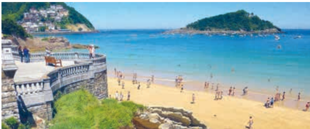
Мал. 193. Пляжы Іспаніі

Свет і Беларусь. Якія рэсурсы для развіцця турызму маюцца ў Рэспубліцы Беларусь? Якія змены адбыліся ў развіцці турызму ў Беларусі за апошнія пяць гадоў? Якія аб'екты на тэрыторыі Беларусі найбольш цікавыя для замежных грамадзян? Прывядзіце прыклады падзейнага турызму ў нашай краіне.