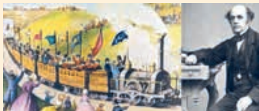
Мал. 192. Першая масавая турысцкая паездка, арганізаваная Т. Кукам

У свеце цікавага. 5 ліпеня 1841 г. брытанскі прадпрымальнік Томас Кук, у той час актыўны змагар з п'янствам у Англіі, арганізаваў першую ў свеце групавую турысцкую паездку. Па яго патрабаванні чыгуначная кампанія Midland Counties Railway дала спецыяльны цягнік для «безалкагольнай» паездкі 570 рабочым па маляўнічым маршруце паміж гарадамі ў Сярэдняй Англіі. 570 «сяброў цвярозасці» пагрузіліся ў дзевяць адкрытых вагонаў (мал. 192). У далейшым у рэкламных мэтах чыгункі сталі прадастаўляць Т. Куку зніжкі, якія дазвалялі арганізоўваць забяўляльныя паездкі і для людзей з самымі абмежаванымі фінансавымі магчымасцямі. Экскурсіі і вандроўкі грунтаваліся на вельмі дзейсным прынцеце: «Атрыманне максімальнай выгады для максімальнай колькасці людзей па мінімальнай цане». Так быў пакладзены пачатак сусветнаму групавому турызму.