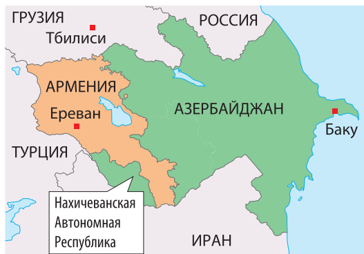
Рис. 14. Эксклав Азербайджана — Нахичеванская Автономная Республика, отделённая территорией Армении