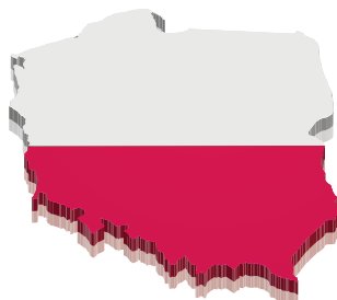
Рис. 12. Компактная форма государственной территории Польши