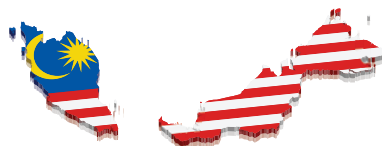
Рис. 13. Фрагментарная форма государственной территории Малайзии

4) Государства, имеющие в своём составе анклавы/эксклавы — небольшие районы, отрезанные от основной территории государства землями других стран или расположенные внутри территории других государств (напр., анклавное положение занимают Калининградская область России, Нахичевань в Азербайджане, отделённая от него территорией Армении (рис. 14)).