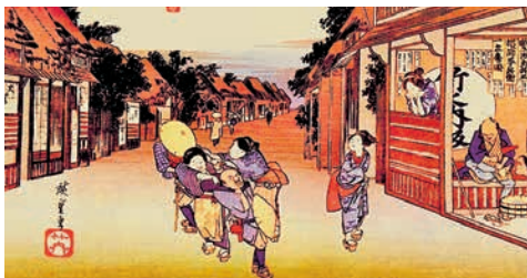
Японский средневековый город

Опираясь на отряды многочисленных самураев, даймё начали вооруженную борьбу за подчинение императора и всей страны своей власти. В 1192 г. Минамото Ёритомо провозгласил себя сёгуном — «великим полководцем». Императоры стали считаться религиозными покровителями страны, а реальная власть оказалась в руках сёгунов рода Минамото.