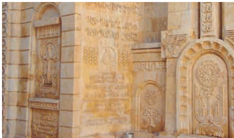
Христианская армянская церковь 40 мучеников, г. Алеппо, Сирия. XV в.