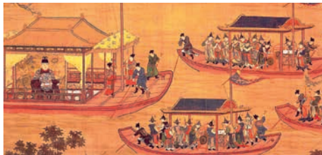
Император Цзянцин на барже. Свиток. Ок. 1538 г.

В 485 г. в Китае была введена система «равных полей» . В империи Тан она стала основой организации земледелия. Крестьяне от 15 до 70 лет получали равные участки земли для ведения хозяйства, которые они не могли теперь покидать. Участок делился на две части: землю в личной собственности и обрабатываемую землю, с которой надо было платить налог государству. Если крестьянин не мог обрабатывать землю, государство забирало ее и оставляло только личный участок. При этом сохранялись крупные владения родовой аристократии, которая также стремилась привлечь крестьян для работы на своих землях.