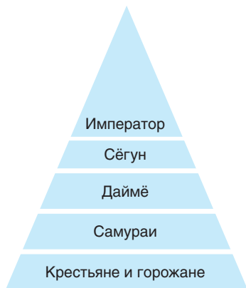
Иерархическая организация японского общества

власть была первоначально сильна. Однако здесь еще не было преодолено влияние родовой аристократии, которая имела значительную экономическую и политическую власть. Взяв за пример систему рангов и систему наделов «равных полей» в Китае, императоры, наоборот, усилили аристократию. В VII–VIII вв. знатные семейства сосредоточили в своих руках обширные земельные владения. Власть на местах перешла к знати, которая, добившись постов руководителей административных округов, передавала их по наследству, а государственные территории рассматривала как свои собственные владения. Крупные землевладельцы — даймё — содержали профессиональные военные отряды, состоящие из воинов- самураев . В результате, в отличие от Китая, в Японии сложилась система связей, которая напоминала европейскую феодальную лестницу. Крестьяне