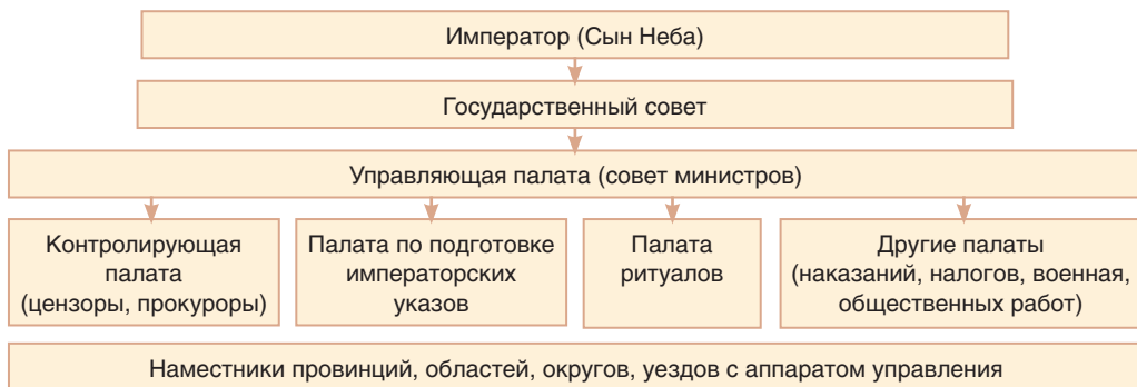
Система государственного управления империи Тан (618–907 гг.)

Аристократические семьи были крупными землевладельцами и относились к привилегированной части общества. К ней же принадлежали получившие образование чиновники, но свои посты, землю и привилегии они не могли передать по наследству. Все имевшие собственность относились к «доброму люду». В городе это были купцы и ремесленники. Однако основу китайского общества составляли крестьяне, которых объединяла община, выполнявшая хозяйственные и административные функции. Самое низкое положение в обществе занимал «подлый люд»: зависимые крестьяне, рабы, слуги. Они располагали только небольшой личной собственностью и полностью зависели от хозяев.