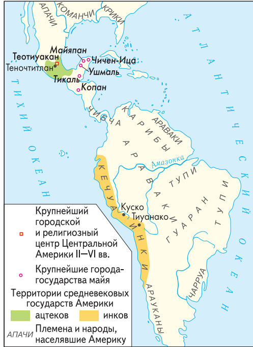
Цивилизации Америки в Средние века

Города-государства майя нередко вели между собой жестокие междоусобные войны. Иногда какой-то город одерживал победы. Но никто так и не сумел объединить их в государство с единой культурой.