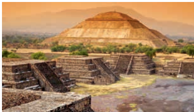
Пирамида Солнца, Теотиуакан