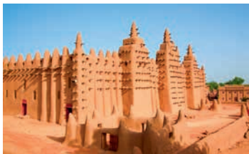
Тимбукту — крупнейший город Мали, основанный туарегами

В Восточной Африке к югу от пустынь еще в древности образовались небольшие ранние государства. В верхнем течении реки Нил во II в. возникло государство Аксум. Здесь начало распространяться христианство. С XII в. в горной местности сформировалось Эфиопское государство, в котором христианство стало официальной религией.