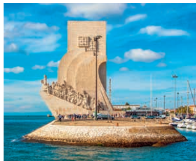
Памятник первооткрывателям, г. Лиссабон, Португалия

Зато в борьбу вступили английские искатели приключений, которых поддерживало государство. Англичане совершали дерзкие нападения на испанское побережье Америки, захватывали и грабили испанские корабли, нагруженные золотом и ценными товарами. Эта добыча затем поступала в королевскую казну. Пиратство наносило настолько ощутимый урон испанцам, что привело к войне между Испанией и Англией (1585–1604). В ходе военных действий Англии, к удивлению Европы, сопутствовал успех. Англия развернула контрабандную торговлю (в том числе продажу рабов из Африки испанским колонистам) и всячески поощряла пиратство .