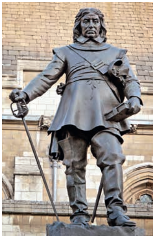
Статуя О. Кромвеля, г. Кембридж, Великобритания

В 1645 г. военный и политический деятель Оливер Кромвель реорганизовал армию парламента в так называемую армию «нового образца». Под его энергичным руководством она превратилась в хорошо организованную и мощную силу. В нескольких боях она разбила кавалеров и в 1646 г. взяла в плен самого короля.