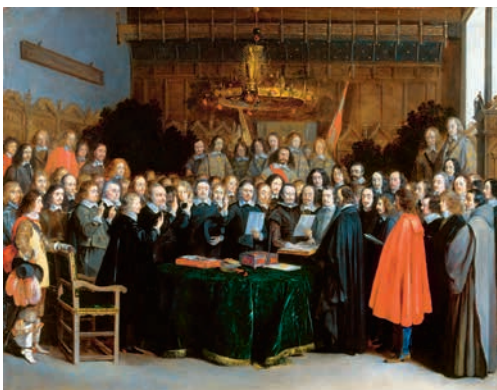
Подписание Вестфальского мира в Мюнстере. Художник Герард Терборх . 1648 г.

Вестфальский мир подготовил французскую гегемонию в Европе. Территориальные приобретения, а также поддержка германских протестантских княжеств превратили Францию в европейского лидера более чем на столетия. Однако Война за испанское наследство (1701–1714) ознаменовала не только падение Испании,