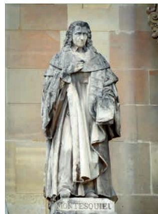
Статуя Ш. Монтескье в Лувре, г. Париж, Франция