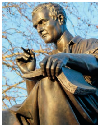
Статуя Ж. Ж. Руссо, г. Женева, Швейцария

Большую роль в ограничении власти монарха и движении общества к народному суверенитету сыграла идея