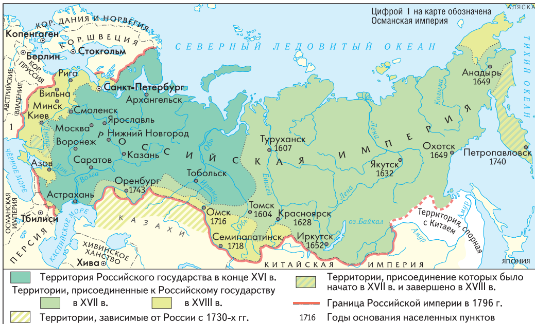
Рост территории Российского государства в XVII–XVIII вв.

Большое значение для будущего страны имело освоение Сибири. Необъятная по территории, населенная немногочисленными народами, обильная различными богатствами Сибирь была идеальным местом для колонизации. Отряды казаков продвигались по могучим сибирским рекам и основывали остроги — небольшие укрепленные поселения. Местные народы платили дань дорогой пушниной и другими товарами. Постепенно остроги смогли контролировать всю территорию. Переселенцы в основном были торговцами и служилыми казаками. Затем сюда стали переселяться крестьяне, большинство из которых бежали от крепостничества. Русские землепроходцы высадились также на севере Америки — на Аляске, которую начали осваивать. Вскоре произошло продвижение русских поселенцев в казахские степи.