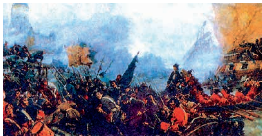
Взятие Выборга. Художник Валентин Печатин. 1920 г.

В это время Карл XII вел долгую войну в Польше и Беларуси. Армия Петра I стала совершать походы на территорию Речи Посполитой вплоть до Гродно, чтобы поддержать своего союзника. Карл понял, что Россия стала теперь главным противником, и начал поход на восток. Но продвижение к Москве было связано с множеством трудностей, и армия двинулась в Украину, где украинский гетман Иван Мазепа обещал поддержку и продовольствие. 27 июня 1709 г. шведская армия потерпела сокрушительное поражение под городом Полтава. Карл XII бежал в пределы Османской империи. Именно эта победа окончательно поставила Россию в один ряд с европейскими государствами. И хоть после этого поход Петра I против Турции оказался неудачным (пришлось вернуть Азов и подписать невыгодный мир), для Швеции это ничего не меняло.