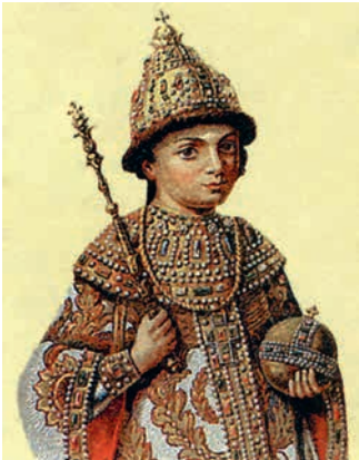
Юный Петр на парсуне

Вернувшись в страну, Петр начал проведение реформ с целью преодолеть экономическое и культурное отставание от Западной Европы. В России был введен юлианский календарь, празднование начала нового года переносилось на 1 января. Всем, кроме духовенства и крестьян, было приказано брить бороды и носить одежду европейского образца. Детей знати посылали учиться в Европу. Из Европы приглашали специалистов в области различных наук. По мысли Петра, все это должно было сделать Россию европейским государством.