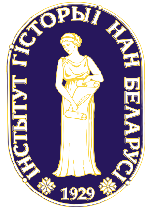
Эмблема Института истории Национальной академии наук Беларуси

В наше время историческая наука развивается благодаря усилиям не только отдельных ученых, но и целых институтов. Ведущим центром исследований в нашей стране является Институт истории Национальной академии наук Беларуси.