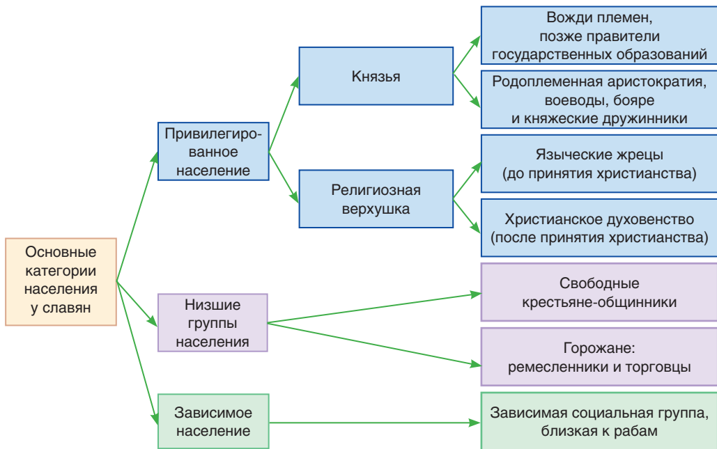
Социальная структура средневекового славянского общества

В Древней Руси великий князь считался верховным собственником всех земель, население которых платило ему дань. В течение IX–XI вв. такая форма земельной собственности — княжеская (государственная) — являлась