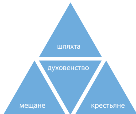
Основные станы-сословия ВКЛ

Складывание состояний-сословий феодального общества. Развитие феодальных отношений на белорусских землях сопровождалось разделением общества на сословия. В Великом Княжестве Литовском для обозначения сословий употребляли термин «стан». Под станами-сословиями в феодальном обществе понимались группы людей, имевшие одинаковое правовое положение. Сложились они в XVI в. До тех пор шел процесс их становления.