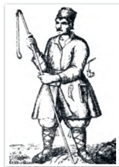
Белорусский крестьянин. Рисунок XVII в.

На протяжении второй половины XVI — XVII в. происходило постепенное сближение социального положения различных категорий крестьян. Например, из-за увеличения земельных наделов крестьяне-огородники сливались с основной массой крепостных. К концу XVIII в. самая зажиточная часть крестьян — бояре и земляне — превратилась в чиншевых крестьян, постепенно исчезли различия между осадными и чиншевыми крестьянами: и те и другие стали сочетать барщину с денежным оброком.