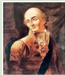
Антоний Тизенгауз. Художник Ян Рустем. 1809 г.

Антоний Тизенгауз (1733—1785) происходил из шляхетского рода, который имел немецкие корни. Занимал должности подскарбия ВКЛ, городенского старосты, администратора королевских экономий. Центром деятельности Тизенгауза были города Городня и Постава. После провала «экономического чуда» Тизенгауза его отстранили от управления экономиями в 1780 г.