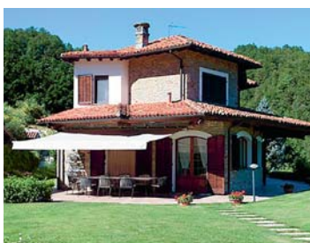
Villa de Sol

José: Uff, no sé ... A ti ¿qué casa te gusta más?