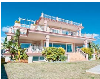
Villa de Oro