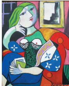
La mujer con el libro. Pablo Picasso