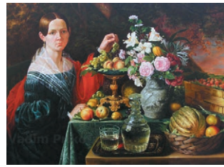
Retrato de la mujer con flores y frutas. Ivan Khrutsky

24. Lee el texto y contesta ¿qué tipo de feria es la Feria del Arco? ¿Qué tipo de arte expone? ¿Por qué es muy democrática?