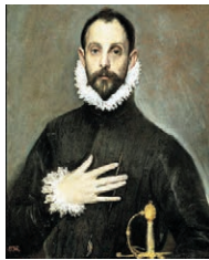
El caballero de la mano en el pecho. El Greco