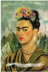
Autorretrato con collar de espinas. Frida Kahlo

23. ¿Qué te parecen estas obras de autores famosos? Coméntalo con tus compañeros. ¿Con quién crees que compartes más tus gustos?