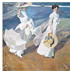
Paseo a orillas del mar

Paseo a orillas del mar es uno de los cuadros más conocidos de Sorolla. A este artista se le ha llamado el pintor “de la luz”, ... . Este cuadro, firmado en 1909, es uno de los claros ejemplos de la influencia del impresionismo francés en su pintura debido a su estancia en París. De este estilo tomó el tratamiento de la luz y del color, ... . Es el mejor representante de la influencia del impresionismo en España.