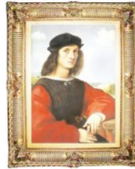
Porträt / das Bildnis / das Selbstbildnis