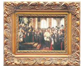
das historische Gemälde