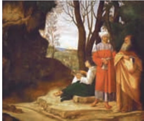
Джорджоне. Три философа. 1509 г.

Существует несколько интерпретаций (объяснений) известной картины XVI в. «Три философа». Наиболее распространённым является представление, что персонажи олицетворяют древнегреческую философию (старец), арабскую (взрослый мужчина) и философию Возрождения (юноша). Картина как бы символизирует передачу знаний древнегреческой философии через арабские переводы итальянскому Возрождению.