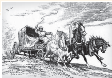
А. М. Лантев. Птица-тройка

Символичность имени Чичикова, связанный с этим героем образ птицы-тройки, мотив дороги помогают реализовать замысел писателя — раскрыть возможности для духовного воскресения и возрождения человека.