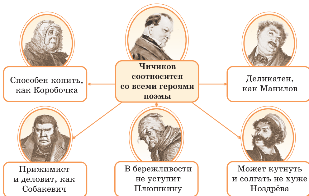
Схема 3. Сходство Чичикова с помещиками

будто застыло. Поместная и городская провинциальная жизнь описана в общих чертах, характерных для быта первой половины XIX века.