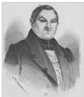
П. М. Боклевский. Чичиков

2. «Гоголь чувствовал — и многие другие чувствовали с ним — позади мёртвых душ души живые» (А. И. Герцен).