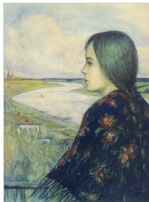
И. С. Глазунов. Катерина

Важную роль в пьесе выполняет рассказ героини о своём детстве и юности. Здесь Островский прибегает к антитезе, подчёркивая подчинённый, несвободный статус замужней женщины. Воспоминания Катерины пронизаны чистотой и наивностью, где главным образом-символом становится родительский дом. Героиня видит ангелов (Борис влюбляется в её «ангельскую улыбку») «в солнечный день»: «Рано утром в сад уйду, ещё только солнышко восходит, упаду на колена, молюсь и плачу...» В отличие от Кабанихи её Бог светлый, солнечный, добрый.