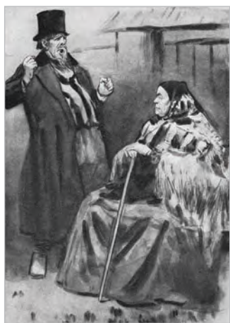
С. В. Герасимов. Дикой и Кабаниха

устои города Калинова «тёмным царством». Действительно, представители старшего поколения — Дикой и Кабаниха — пытаются сохранить прежние правила жизни, где нужно беспрекословно подчиняться, где деньги определяют право и силу. Так, чем более богатым становится Дикой, тем грубее и бесцеремоннее он выглядит в пьесе, «у него вся жизнь основана на ругательстве». Люди слабее и беднее его — это «червяки». Будучи сильным материально, Дикой слаб духовно. Он одинок, потому что в каждом человеке видит разбойника. Дикой жалуется Кабановой: «Ты только одна во всём городе умеешь меня разговаривать». Грубость, произвол, невежество делают героя жертвой собственного своеволия и безнаказанности.