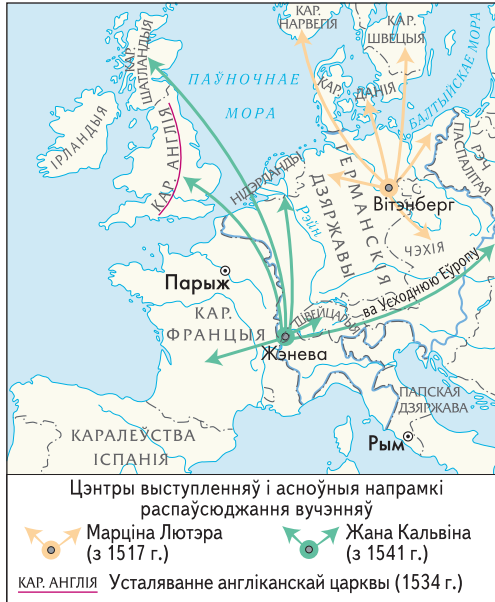
Распаўсюджанне пратэстантызму ў Еўропе

Яшчэ ў 1529 г. імператар Карл V заклікаў аднавіць каталіцкае богаслужэнне і выкараніць вучэнне Лютэра ў Свяшчэннай Рымскай імперыі. Большасць германскіх князёў падтрымалі імператара. Аднак 5 князёў-лютэран і 14 гарадоў заявілі пратэст, адкуль і пайшла іх агульная назва — пратэстанты. У адказ імператар Карл V пачаў у 1547 г. ваенную кампанію ў мэтах прымусіць лютэранскіх князёў вярнуцца