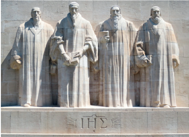
Сцяна Рэфармацыі, г. Жэнева, Швейцарыя

Як вы думаеце, каго ўвасабляюць статуі на ілюстрацыі? Раствлумачце свой пункт гледжання.