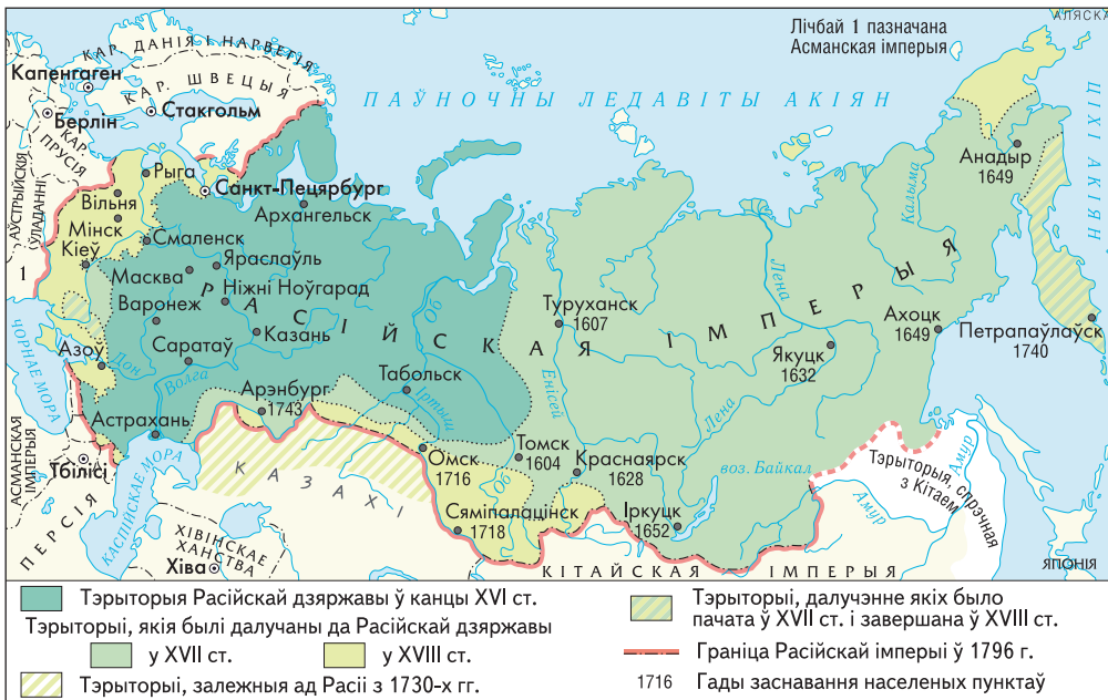
Рост тэрыторыі Расійскай дзяржавы ў XVII–XVIII стст.

Вялікае значэнне для будучыні краіны мела асваенне Сібіры. Неабсяжная па тэрыторыі, населеная нешматлікімі народамі, поўная розных багаццяў Сібір была ідэальным месцам для каланізацыі. Атрады казакоў рухаліся па магутных сібірскіх рэках і засноўвалі астроскі — невялікія ўмацаваныя паселішчы. Мясцовыя народы плацілі даніну дарагім футрам і іншымі таварамі. Паступова астроскі змаглі кантраляваць усю тэрыторыю. Перасяленцы ў асноўным былі гандлярамі і служылымі казакамі. Затым тут пачалі асядаць сяляне, большасць з якіх уцякалі ад прыгону. Рускія землепраходцы высадзіліся таксама на поўначы Амерыкі — на Алясцы, якую пачалі асвойваць. У хуткім часе адбыўся рух рускіх пасяленцаў у казахскія стэпы.