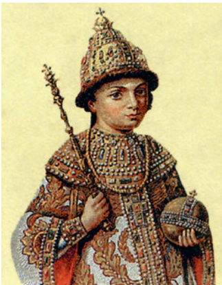
Юны Пётр на парсуне

Вярнуўшыся ў краіну, Пётр пачаў правядзенне рэформаў з мэтай пераадолець эканамічнае і культурнае адстаўанне ад Заходняй Еўропы. У Расіі быў уведзены юліянскі каляндар, святкаванне пачатку новага года пераносілася на 1 студзеня. Усім, акрамя духавенства і сялян, было загадана галіць бароды і насіць адзенне еўрапейскага ўзору. Дзяцей знаці пасылалі вучыцца ў Еўропу. З Еўропы запрашалі спецыялістаў у галіне розных навук. На думку Пятра, усё гэта павінна было зрабіць Расію еўрапейскай дзяржавай.