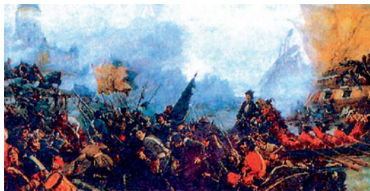
Узяцце Выбарга. Мастак Валянцін Пячацін . 1920 г.

Швецыя прадаўжала супраціўляцца, спадзеючыся на моц свайго флоту, які панаваў на Балтыйскім моры. Але рускі флот, што хутка рос,