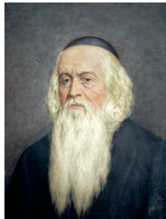
Ян Амос Каменскі