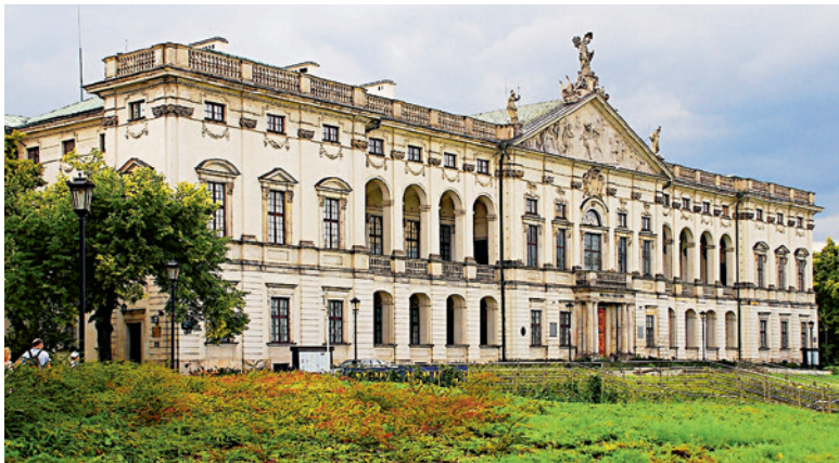
Палац Красіньскіх, г. Варшава, Польшча

знішчалі кнігі на славянскіх мовах, а з іншага — стварылі сваю сістэму адукацыі, друкарні, аказалі ўплыў на развіццё культуры ў цэлым.