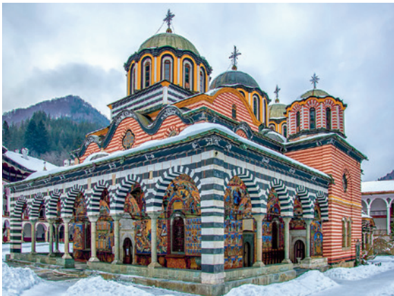
Рыльскі манастыр, Балгарыя

Тэрытарыяльныя страты імперыі Габсбургаў у сярэдзіне XVIII ст. прывялі да ўсведамлення неабходнасці правядзення рэформаў. У перыяд кіравання Марыі Тэрэзіі і Іосіфа II у краіне былі праведзены ваенная, зямельная, адміністрацыйная, рэлігійная і школьная рэформы. Яны абумовілі, з аднаго боку, інтэграцыю славянскіх зямель у агульнаімперскую сістэму, а з другога — рост цікавасці да ўласна славянскай гісторыі і традыцый.