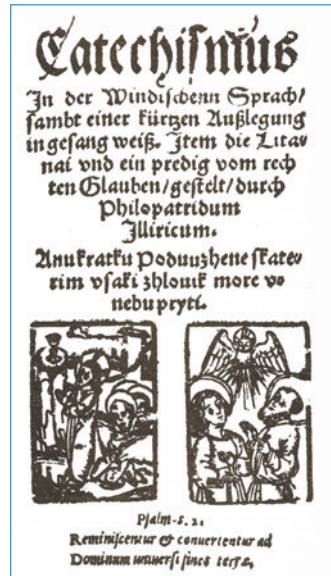
«Катэхізіс» (1550) — першае выданне на славенскай мове (выдаў П. Трубар пад псеўданімам «лірыіскі патрыёт»)

Сфера адукацыі і культуры перайшла да езуітаў. Яны, з аднаго боку, зачынялі пратэстанцкія школы,