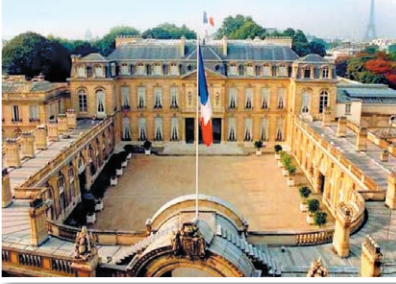
Le Palais de l'Élysée