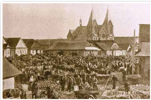
Мястэчка Ракаў. 1910 г.