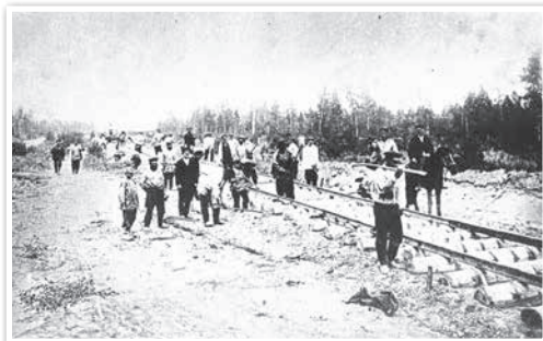
Рабочыя ўкладваюць рэйкі на будаўніцтве чыгункі ў Беларусі. Фота 1870 г.

Інтэнсіўнае чыгуначнае будаўніцтва зрабіла значны ўплыў на развіццё гаспадаркі беларускіх губерняў. За першыя 25 гадоў эксплуатацыі Палескіх чыгунак колькасць фабрычна-заводскіх прадпрыемстваў у рэгіёне вырасла ў 6 разоў, а грузаабарот гэтай транспартнай магістралі — у 50 разоў. Дзякуючы чыгункам эканоміка Беларусі аказалася цесна звязанай з эканомікай усёй Расійскай імперыі і з усерасійскім рынкам. Узмацніліся эканамічныя сувязі з краінамі Заходняй Еўропы. З 1880 па 1900 г. аб'ём перавозак па чыгунках Беларусі павялічыўся амаль у два разы.