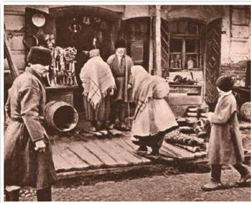
Крамны гандаль у Пінску. Канец XIX ст.

мысловасці і сельскай гаспадарцы, рост гарадскога насельніцтва, развіццё чыгуначнага транспарту, сродкаў сувязі і выхад на рынак вялікай колькасці прамысловай прадукцыі прывялі да заняпаду кірмашовай формы гандлю. Усё большае значэнне набываў стацыянарны магазінны і крамны гандаль. Гэта дазваляла весці яго больш раўнамерна на працягу года, не арыентуючыся на ўмовы надвор'я.