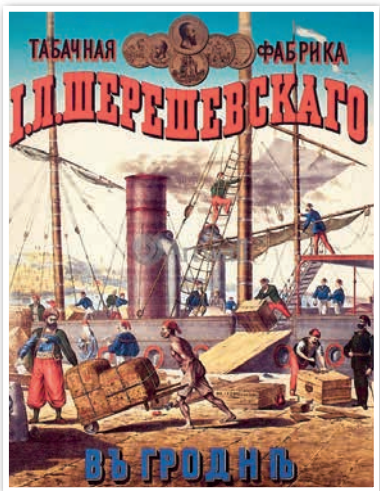
Рэкламны плакат. 1888 г.

Акцыянерным таварыствам належалі такія буйныя прадпрыемствы Беларусі, як Віцебская льнопрадзільная фабрыка «Дзвіна» (Руска-Бельгійскае акцыянернае таварыства), трамвай і электрычная станцыя ў Віцебску (Бельгійскае акцыянернае таварыства), Шклоўская папяровая фабрыка (Рускае акцыянернае таварыства кардонна-папяровай вытворчасці). У гэты час былі створаны і мясцовыя манапалістычныя