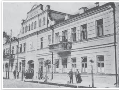
Будынак філіяла Азоўска-Данскога банка ў Пінску. Пачатак XX ст.

Пабудаваныя да канца XIX ст. Рыга-Арлоўская, Маскоўска-Брэсцкая, Лібава-Роменская і Палескія чыгункі звязвалі цэнтральныя раёны Расіі з заходнімі губернямі і портамі Балтыкі. Беларусь атрымала чыгуначную сувязь з важнейшымі індустрыяльнымі раёнамі: Цэнтральна-прамысловым (Масква), Паўночна-Заходнім (Санкт-Пецярбург, Рыга), Паўднёва-Украінскім (Крывы Рог, Данбас), Польшкім (Варшава — Лодзь).