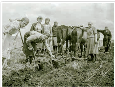
Пасадка бульбы ўручную. Беларуская дзяржаўная селекцыйная станцыя «Заазер'е». 1956 г.

Рэформа першапачаткова дала станоўчыя вынікі. У гады восьмай пяцігодкі (1966—1970 гг.) прырост валавой прадукцыі склаў 18 %. Павышалася культура земляробства. У калгасах і саўгасах павялічылася колькасць механічных устаноў і прыстасаванняў, якія павышалі прадукцыйнасць і аблягчалі ўмовы працы.