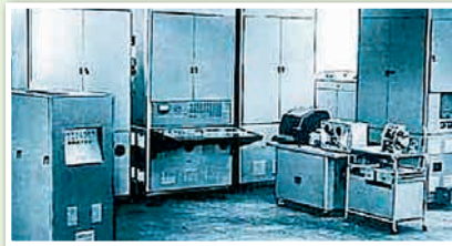
ЭВМ «Мінск-1» у першай палове 1960-х гг. — лідзіруючы тып серыйных лямпавых машын такога тыпу ў СССР

Аб чым сведчыў факт выпуску электронна-вылічальных машын у БССР?