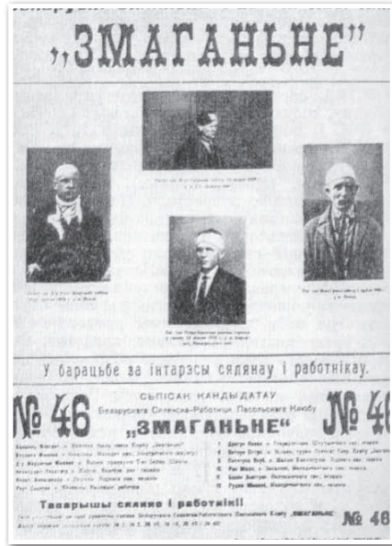
Плакат «Змаганья». 1930 г.

У 1938 г. кампартыі Польшчы, Заходняй Беларусі і Заходняй Украіны былі распушчаны па рашэнні Выканкама Камінтэрна, паколькі абвінавачваліся ў супрацоўніцтве з польскімі ўладамі. Гэта падарвала нацыянальна-вызваленчую барацьбу ў Заходняй Беларусі. Польскія ўлады, у сваю чаргу, забаранілі далейшую дзейнасць беларускіх нацыянальных дэмакратычных арганізацый, а некаторыя іх кіраўнікі былі асуджаны да суду.