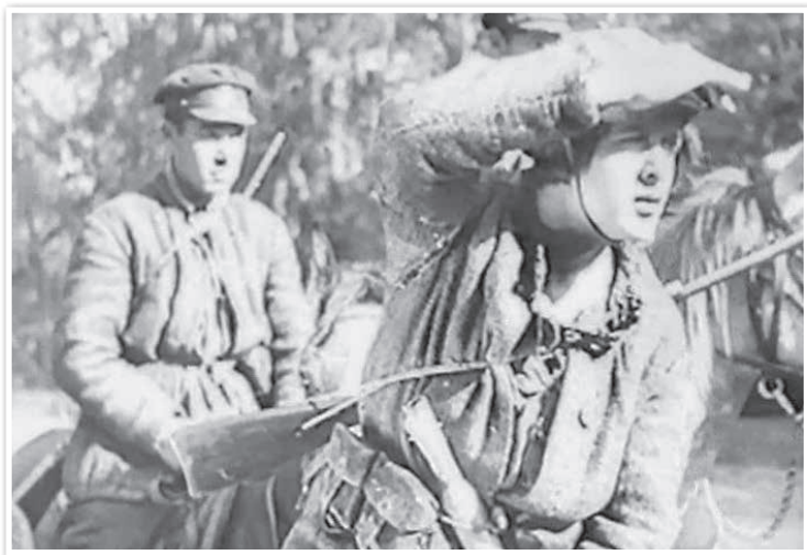
Кадр з мастацкага фільма «Лясная быль». Рэжысёр Ю. Тарыч. 1926 г.

Зараджэнне беларускага кіно. У 1920-я гг. беларускі кінематограф пачаўся са здымкаў дакументальных фільмаў. За 1925–1926 гг. аператар М. Лявонцьеў зняў больш за 30 стужак, у тым ліку «Меліярацыя БССР», «У здравым целе — здаровы дух». У 1928 г. у Ленінградзе была адкрыта кінастудыя «Савецкая Беларусь», якая ў 1929 г. пераехала ў Мінск.