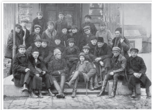
Удзельнікі літаратурнага аб’яднання «Маладняк». 1920-я гг.