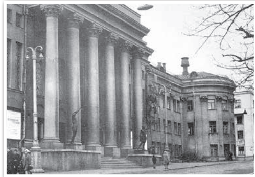
Будынак Беларускага рэспубліканскага тэатра юнага глядача. Архітэктары А. Воінаў, Л. Усава. 1956 г.