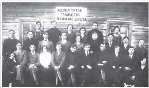
Скідзельскі гурток ТБШ. Красавік 1927 г.

Супраць паланізацыі адукацыі выступала Таварыства беларускай школы — масавая культурна-асветніцкая арганізацыя, створаная ў 1921 г. Ля вытокаў яе стварэння стаялі Б. Тарашкевіч, А. Луцкевіч, С. Рак-Міхайлоўскі, А. Станкевіч і інш. У 1920-я гг. ТБШ стварала беларускія школы, адкрывала бібліятэкі, клубы, хаты-чытальні, гурткі мастацкай самадзейнасці.