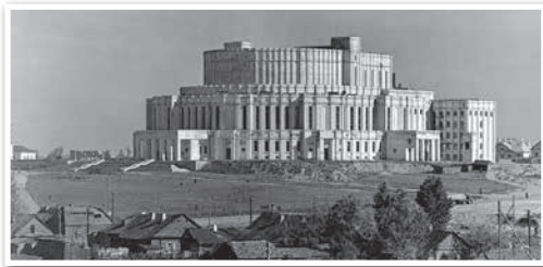
Будынак Тэатра оперы і балета. Архітэктар І. Лангбард. 1930-я гг.