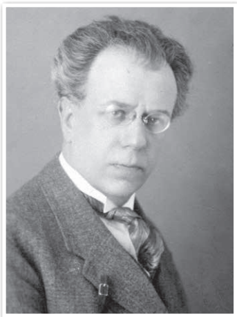
У. Пічэта (1878–1947) — першы рэктар БДУ

і медыцынскага факультэтаў і факультэта грамадскіх навук. Першым рэктарам быў прызначаны вядомы гісторык-славіст У. Пічэта.