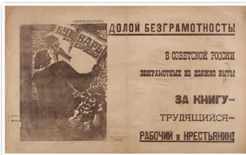
Агітацыйны плакат «Далоў непісьменнасць!». Мастак А. Я. Быхоўскі. 1923 г.

У 1920–1930-я гг. паспяхова развівалася музычнае мастацтва.