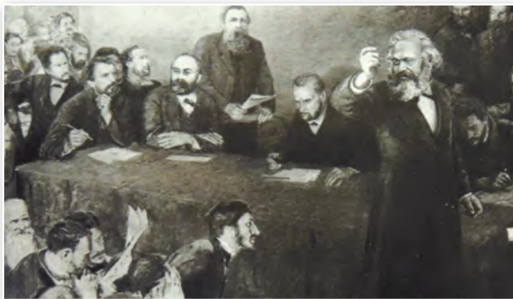
Выступление К. Маркса на съезде I Интернационала

Большой притягательной силой обладал марксизм, провозгласивший своей целью свержение буржуазии, господство пролетариата и основание нового общества, без классов и частной собственности. Во второй половине XIX в. марксисты приступили к созданию политических организаций. В 1864 г. был образован I Интернационал . Затем марксисты основали социал-демократические партии, в которых выделилось два направления: радикальное (революционное) и умеренное (реформистское). В середине 1890-х гг. в социал-демократическом движении усилилось либерально-реформистское крыло. Его идеолог немецкий социалист Э. Бернштейн отрицал необходимость социалистической революции и считал, что частичное построение социализма возможно в рамках капиталистического общественного строя. Тем не менее в созданном в 1889 г. II Интернационале до