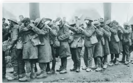
Британские солдаты, пострадавшие от химической атаки германской армии. Апрель 1918 г.