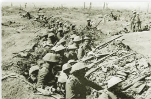
Окопная война. Британские пехотинцы во время битвы на Самме. 1916 г.