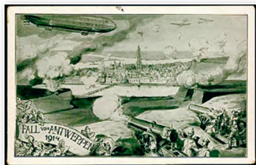
Антверпен стал первым в истории городом, подвергшимся бомбардировкам с воздуха. Открытка. 1914 г.

Новый облик войны. Некоторые факторы изменили традиционный характер войны. Прежде всего сыграл роль научно-технический прогресс, приведший к созданию оружия массового поражения. Зачастую уже не мужество солдат, а огневая мощь стала решать исход сражений. Применение тяжелых орудий, пулеметов, танков, самолетов, отравляющих газов и подводных лодок значительно расширило границы военных действий, невероятно увеличивало количество убитых и раненых. Всего в годы Первой мировой войны было убито или умерло от ран около 8,5 млн солдат и офицеров.