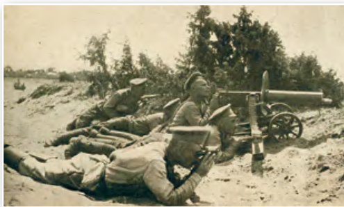
Пулемет Х. Максима (или просто «максим») образца 1910 г. Широко применялся в годы Первой мировой войны

Прочитайте роман немецкого писателя Эриха Марии Ремарка «На Западном фронте без перемен». Почему эту книгу называют манифестом «потерянного поколения»? Что нового для понимания Первой мировой войны дает это художественное произведение?