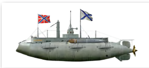
Подводная лодка «Дельфин», построенная по проекту И. Г. Бубнова

После высадки войск США во Франции (март 1918 г.) и общего наступления под командованием французского маршала Ф. Фоша Германия вынуждена была перейти к тотальной обороне. Военные поражения, экономическая разруха, наконец, свержение монархии (9 ноября 1918 г.) в результате революционного выступления рабочих и солдат вынудили Германию капитулировать 11 ноября 1918 г. Перед державами-победительницами встал вопрос о том, каким быть миру в Европе.