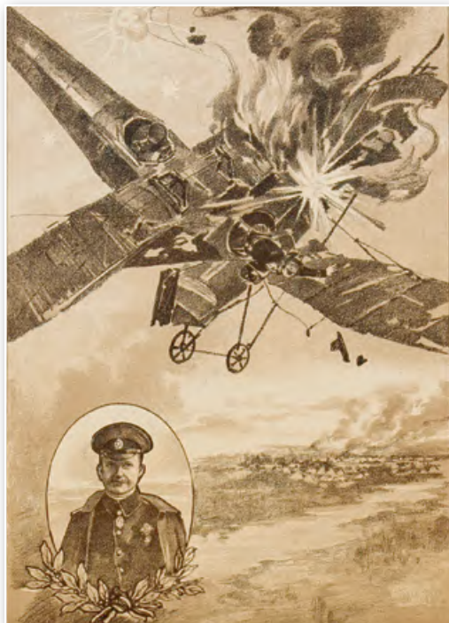
Лубок «Геройский подвиг и гибель знаменитого летчика штабс-капитана П. Н. Нестерова». Литография И. Я. Виноградова. 1914 г.

Тем не менее население всех воюющих стран выступало против войны. Об этом свидетельствуют подъем пацифистского, социального и национального движений, факты братания на фронтах. 3 марта 1918 г. в Брест-Литовске большевистское правительство Советской России заключило сепаратный мир с Германией и ее союзниками. Однако отсутствие второго фронта не спасло их от поражения.