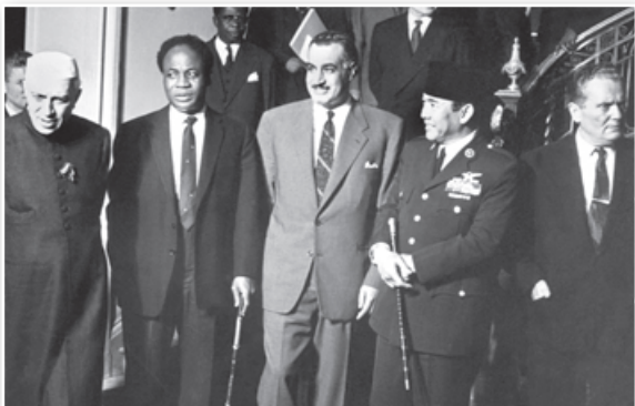
Лидеры Движения неприсоединения на конференции в Бандунге (1955). Слева направо: президент Индии Дж. Неру, президент Ганы Ф. Кваме Нкрума, президент ОАР Г. Абдель Насер, президент Индонезии А. Сукарно, президент Югославии И. Броз Тито

Важную роль в урегулировании таких конфликтов играла ООН. Окончание «холодной войны» фактически не привело к ликвидации локальных конфликтов.