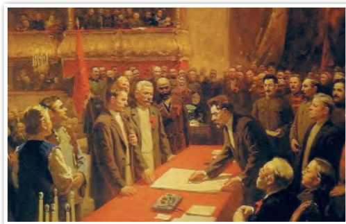
Подписание договора об образовании СССР 30 декабря 1922 г.