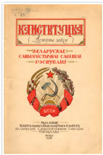
Конституция БССР. 1927 г.

трудились на ниве культуры, просвещения и науки, занимали государственные должности, принимали активное участие в осуществлении политики белорусизации.