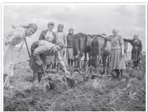
Посадка картофеля вручную. Белорусская государственная селекционная станция «Зазерье». 1956 г.

Реформа первоначально дала положительные результаты. В годы восьмой пятилетки (1966—1970 гг.) прирост валовой продукции составил 18%. Повышалась культура земледелия. В колхозах и совхозах увеличилось количество механических установок и приспособлений, которые повышали производительность и облегчали условия труда.