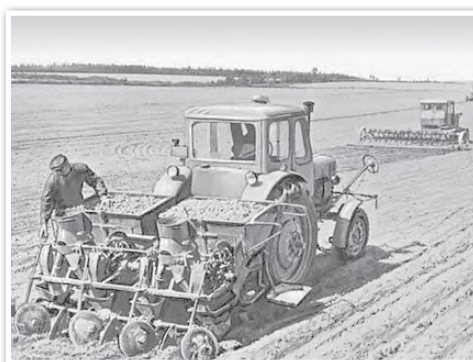
Посадка картофеля в колхозе «Коминтерн» Могилевской области. 1980-е гг.