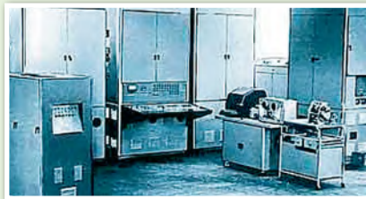
ЭВМ «Минск-1» в первой половине 1960-х гг. — лидирующий тип серийных ламповых машин такого типа в СССР

О чем свидетельствовал факт выпуска электронно-вычислительных машин в БССР?