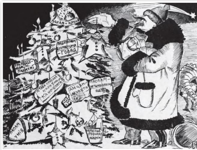
Карикатура на Юзефа Пилсудского в западнобелорусском сатирическом журнале «Маланка»