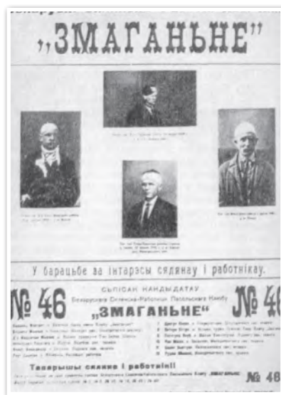
Плакат «Змаганья». 1930 г.

В 1938 г. компартии Польши, Западной Беларуси и Западной Украины были распущены по решению Исполкома Коминтерна, поскольку обвинялись в сотрудничестве с польскими властями. Это подорвало национально-освободительную борьбу в Западной Беларуси. Польские власти, в свою очередь, запретили дальнейшую деятельность белорусских национальных демократических организаций, а некоторые их руководители были отданы под суд.