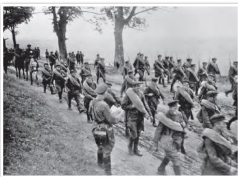
Вступление войск Красной армии на территорию Западной Беларуси. Сентябрь 1939 г.

28–30 октября 1939 г. в Белостоке с целью законодательного закрепления вхождения территорий Западной Беларуси в состав БССР прошло