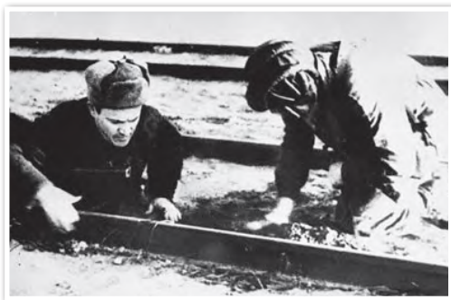
Минирование железнодорожного полотна. Бегомльский район. 1944 г.

Конкретизируйте примерами вывод о взаимосвязи между боевыми действиями на советско-германском фронте и активизацией подпольной и партизанской борьбы на оккупированных территориях.