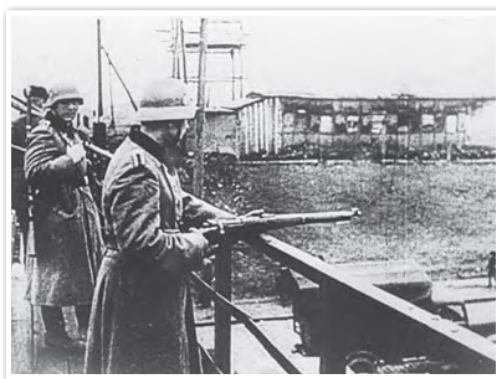
Германский патруль на Западном мосту в Минске (1941–1944 гг.)

На должность генерального комиссара Беларуси был назначен