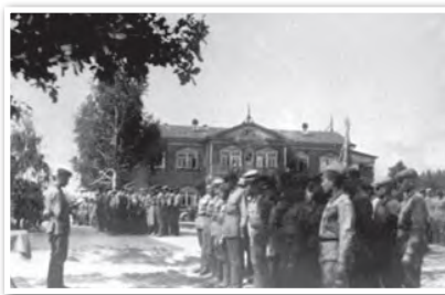
Бойцы Белорусского особого военного сбора принимают присягу перед отправкой в тыл врага. РСФСР, Владимирская область. 1942 г.

Необходимо отметить, что эффективная партизанская борьба была бы невозможна без широкой поддержки местного населения. Оно обеспечивало партизан