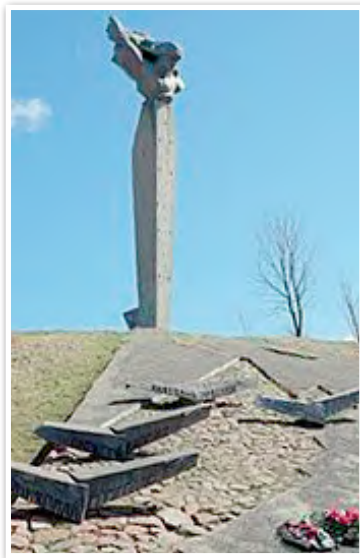
Памятник экипажу Н. Ф. Гастелло. Радошковичи. 1976 г.

Двухмесячное сопротивление Красной армии на территории БССР содействовало срыву гитлеровского