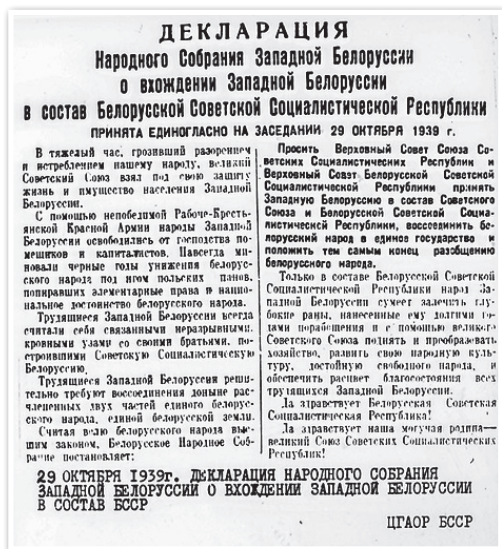
Декларация Народного собрания Западной Беларуси о вхождении Западной Беларуси в состав БССР. 29 октября 1939 г.

Указом Президента Республики Беларусь от 7 июня 2021 г. 17 сентября объявлено Днем народного единства. Этот день стал актом исторической справедливости в отношении белорусского народа, разделенного против его воли в 1921 г. по условиям Рижского мирного договора.