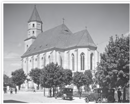
Костел Пресвятой Девы Марии («Фара Витовта») в Гродно (XIV в.). Снесен в 1961 г. как аварийное здание

власти не доверяли католическому духовенству и рассматривали его как антисоветский элемент.