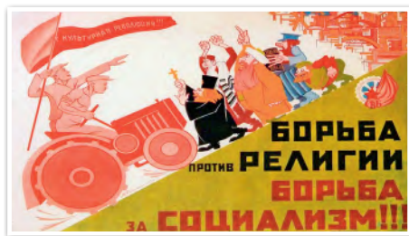
Плакат времен атеистической пропаганды