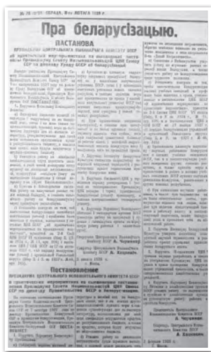
Постановление ЦИК БССР. 1928 г.

Обсудите, о чем свидетельствовало наличие в БССР четырех государственных языков.