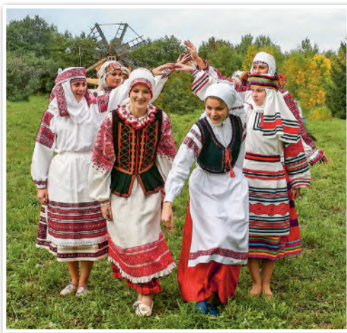
Белорусский национальный костюм