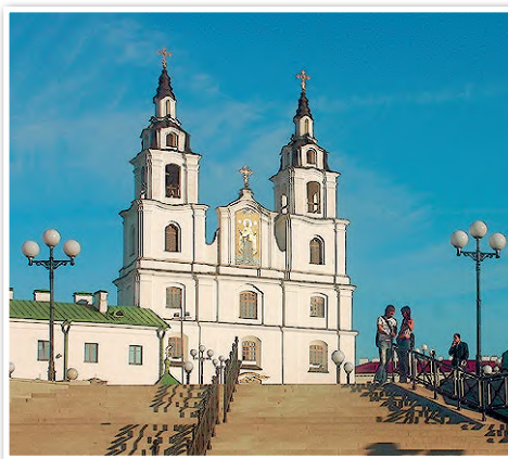
Свято-Духов кафедральный собор в Минске

Протестантские религиозные организации представлены 1057 религиозными общинами, 21 объединением,