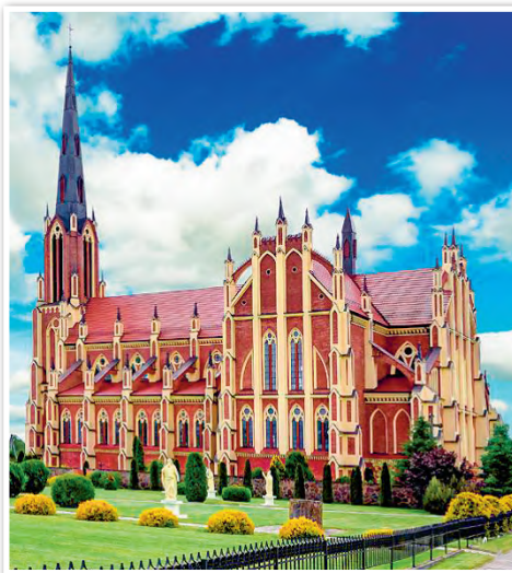
Троицкий костел в д. Гервяты