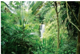
Expedición en la selva del Amazonas