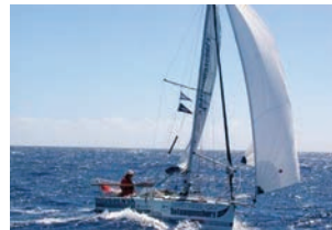
Travesía del Atlántico en barco de vela

Modelo: Me gustaría hacer un safari en un 4×4. Ver a los animales de la sabana en su hábitat.