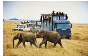
Safari en la sabana africana