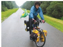
Vuelta al mundo en bici