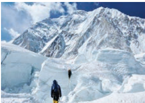
Escalada al Everest