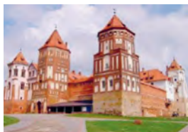
Castillo de Mir

1 triangulación f — триангуляція (метод определения положения геодезических пунктов) / трыянгуляцыя (метад вызначэння знаходжання геадэзічных пунктаў)