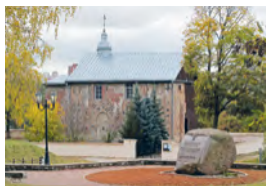
Iglesia de San Borís y San Gleb en Kalozha