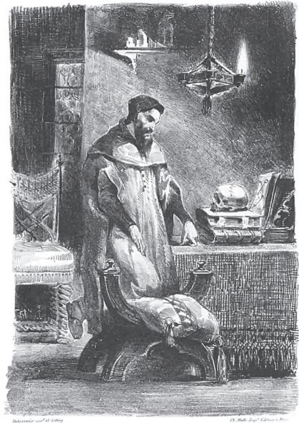
Э. Дэлакруза. Доктар Фаўст