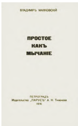
Сборник «Простое как мычание» (1916)

проявляется во всём: неточной и составной рифме, рваном ритмическом рисунке, подчёркнутом неблагозвучии и неологизмах, намеренном нарушении синтаксических и словообразовательных норм.