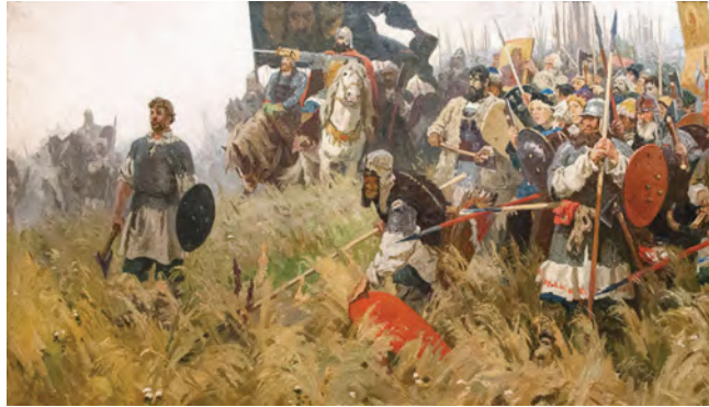
А. Бубнов. Утро на Куликовом поле

патриотической лирике Блока, соответствует гражданской позиции автора-человека. Самым убедительным образом это подтверждает поэма «Двенадцать».