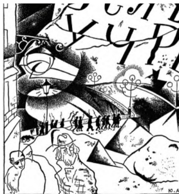
Ю. Анненков. Иллюстрация к поэме «Двенадцать»

В поэме создаётся собираемый образ народа . Следуя принципу историзма, Блок, воодушевлённый идеей социальных преобразований, выдвигает на передний план демократические массы. Из самых низов российского общества собран отряд красногвардейцев. Они полны жажды мщения, подвижны «святой злобой». Опьянённые свободой, грабят, устраивают