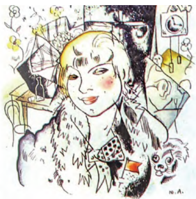
Ю. Анненков. Иллюстрация к поэме «Двенадцать»

На контрасте с Ванькой выписан невольный убийца Катьки Петруха. Самое поэтичное в нём — это любовь-страсть к Катьке, чувство, не покидающее его наперекор рассудку. Безрассудная месть овладевает Петькой и бросает в погоню за тройкой с «еликстрическим фонариком на оглобелях». Искренни страдания «бедного убийцы», оформленные в похожем на плач монологе-причитании: «Ох, товарищи родные, // Эту девку я любил...» Далее хаос чувств упорядочивается идеей долга и служения революции — Петруха вместе с товарищами продолжает «державным шагом» нести дозор.