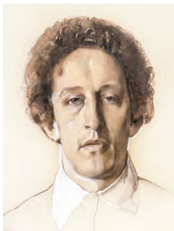
К. Сомов. Портрет А. Блока