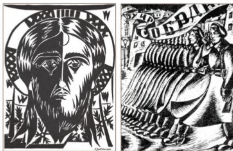
Н. Гончарова, И. Фридлендер. Иллюстрации к поэме «Двенадцать»

Трудно расшифровать смысл поэтических деталей в изображении Христа: он «в белом венчике из роз», а не в привычном терновом венце, в руках Христа «кровавый флаг». Каким смыслом наполнена деталь, если флаг — атрибут революционного движения, а эпитет «кровавый» однозначно ассоциируется с гибелью и трагедией?