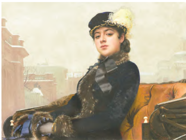
И. Крамской. Неизвестная

женой. От образа незнакомки тянутся нити к героине стихотворения «Железная дорога», родственна она и Катьке в поэме «Двенадцать». Современники видели в девушке воплощение героинь Тургенева, Толстого, Достоевского. Название стихотворения прямо отсылало читателей к популярнейшей картине И. Крамского «Неизвестная» (1883), вызвавшей в своё время множество слухов и догадок. Сам А. Блок говорил, что увидел свою героиню на полотнах М. Врубеля.