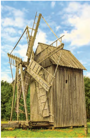
Музей народной архитектуры и быта «Строчицы»

13.9. Прочитайте текст. Найдите все приложения. Что вы можете рассказать о пунктуационном оформлении приложений?