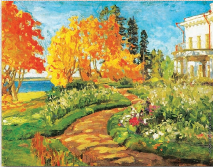
Станіслаў Жукойскі. Восень у сядзібе