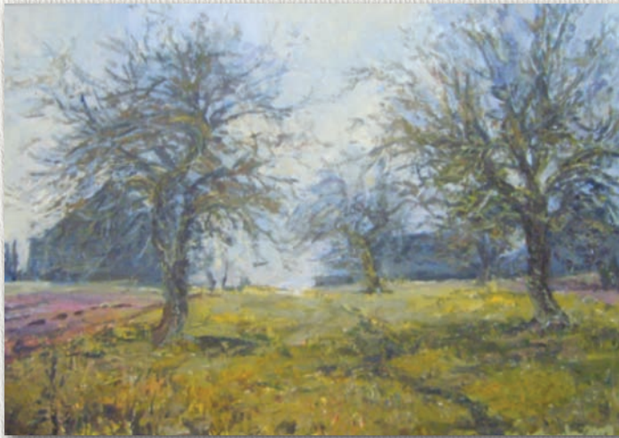
Кастусь Качан. Позняй восенню