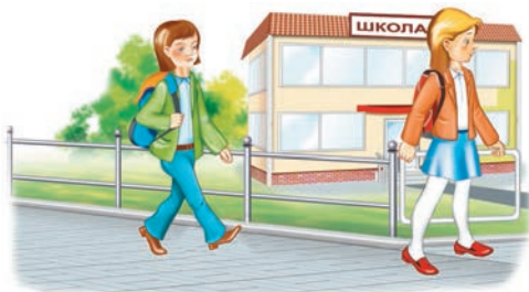
падыходзяць да варот