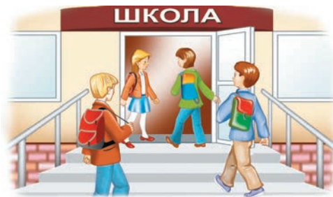
заходзяць у школу

Што аб'ядноўвае выдзеленыя словы? Назавіце ў іх карань. Якімі часткамі адрозніваюцца словы?