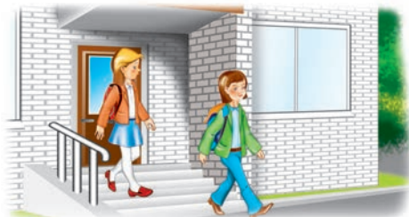
выходзяць з пад'езда

1. Разгледзьце малюнкi. Прачытайце спалучэнні слоў.