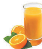
le jus de fruit