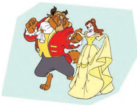
La Bella y la Bestia