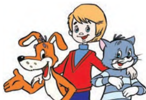
el tío Fiodor