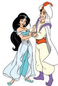
Aladín y Jazmín