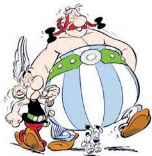
Astérix y Obélix

Modelo: La Bella es morena y delgada. Tiene el pelo largo, los ojos son negros. Es joven y guapa.