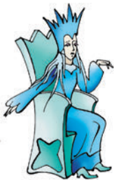
La Reina de las Nieves

Modelo: – ¿Vive en el palacio la Reina de las Nieves? – Sí, la Reina de las Nieves vive en el palacio.