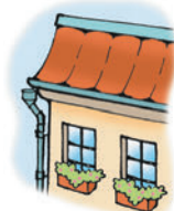
el apartamento / el piso