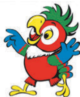
el loro Roma