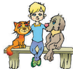
el tío Fiodor