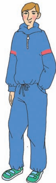
lán yǎn jing 2. 蓝 眼 睛;