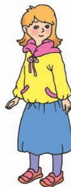
gāo ge zi 3. 高 个 子;